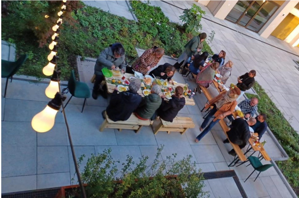
Bijdrage via de tussenvoorziening voor picknicktafels bij Tango

Het aantal ingediende aanvragen per 31 augustus ligt op 137. Het gemiddelde bedrag per aanvraag ligt op € 1.188,39. Er is een stijging van het aantal aanvragen van ruim 20% ten opzichte van 2022. In 2023 kende het fonds € 40.000 toe aan Stichting Noodhulp Utrecht 4 .