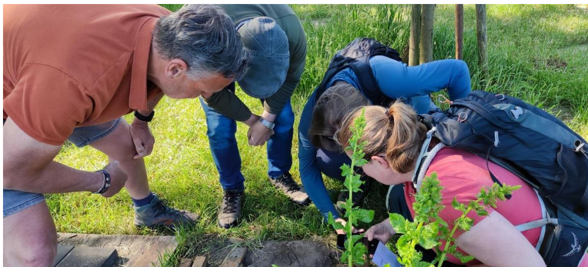
Doorontwikkeling van de Moestuin De Duiventoren op landgoed Remmerstein in Rhenen

Utrecht. Een opvallende trend is de toename van aanvragen gericht op vergroening van schoolpleinen.