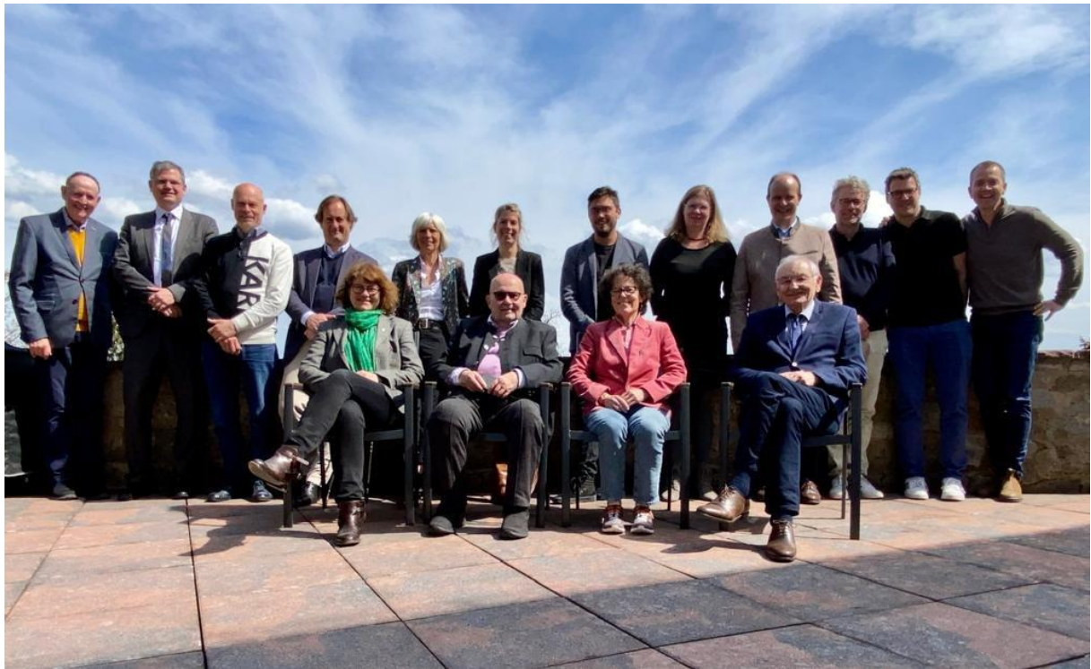
Jaarlijkse bijeenkomst bestuur K.F. Hein Stichting en nazaten K.F. Hein in Obermarsberg, Duitsland

Het aantal overnachtingen neemt in 2022 en 2023 weer toe na de corona-periode.