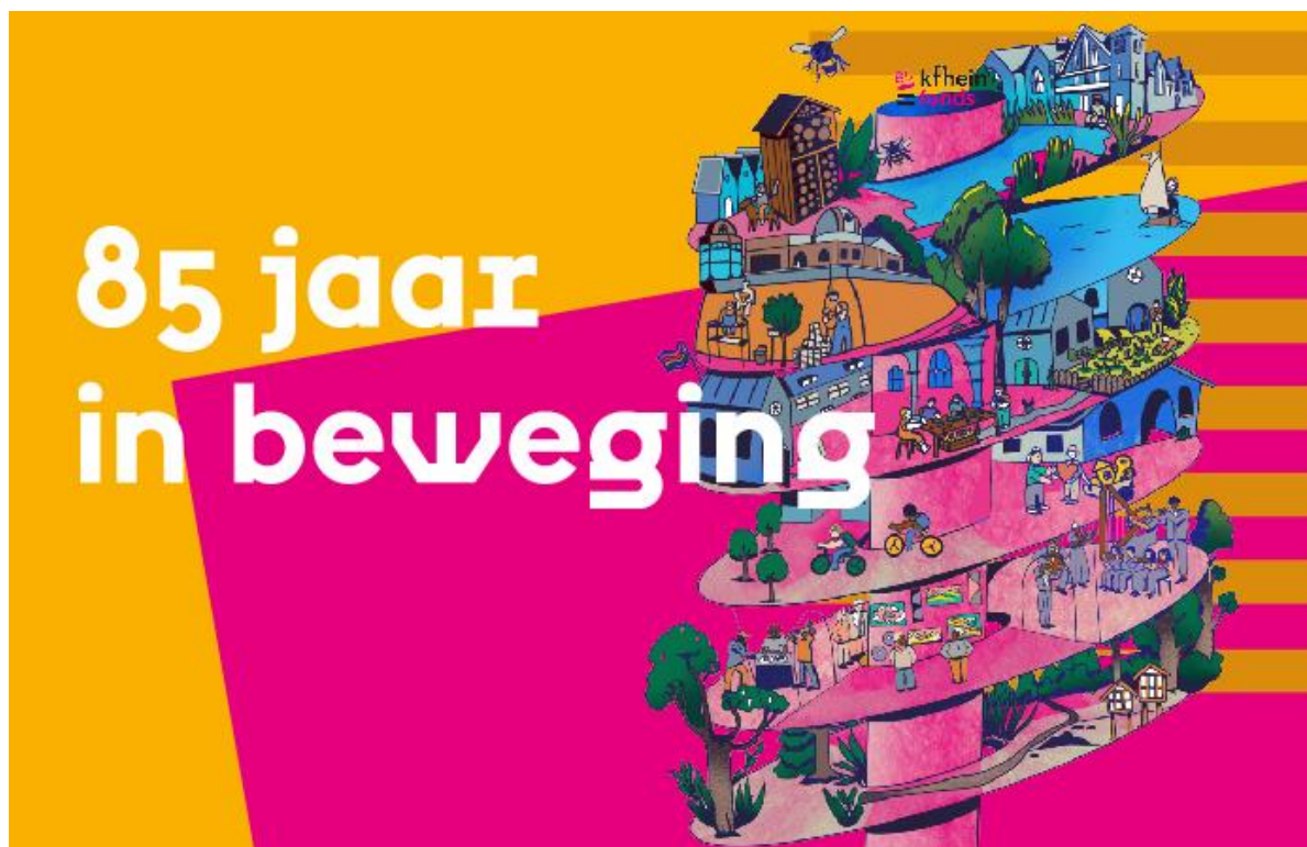
Beeldmateriaal t.b.v. van het jubileumjaar, vormgeving door studio ddo met een illustratie van Leyla Ali

In 2023 vonden er binnen de formatie van het bureau enkele wijzigingen plaats, wat zorgde voor instabiliteit. Tegen het einde van 2023 waren de meeste vacatures ingevuld en was het tijd om vooruit te kijken.