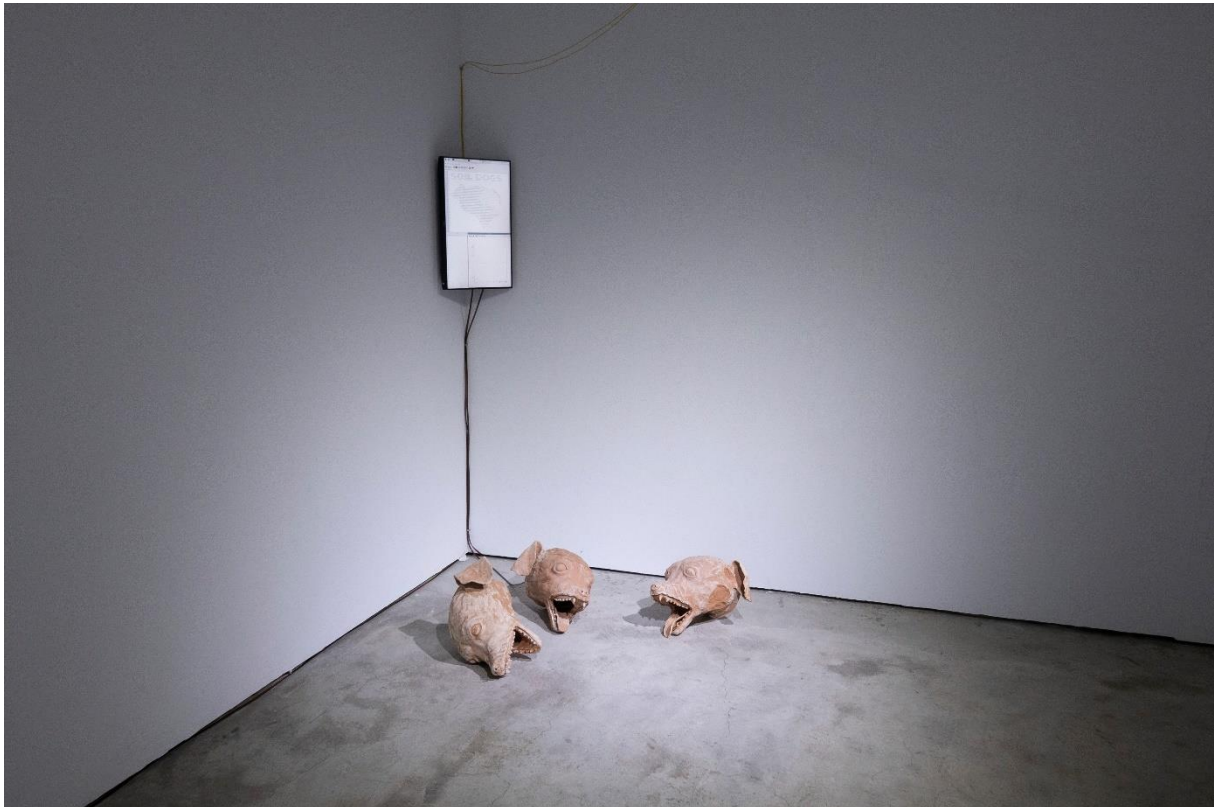
Soil Dogs

gevoeligheid van honden voor aardbevingen gaan doen. Ter plekke presenteerde hij zijn installatie Soil Dogs.