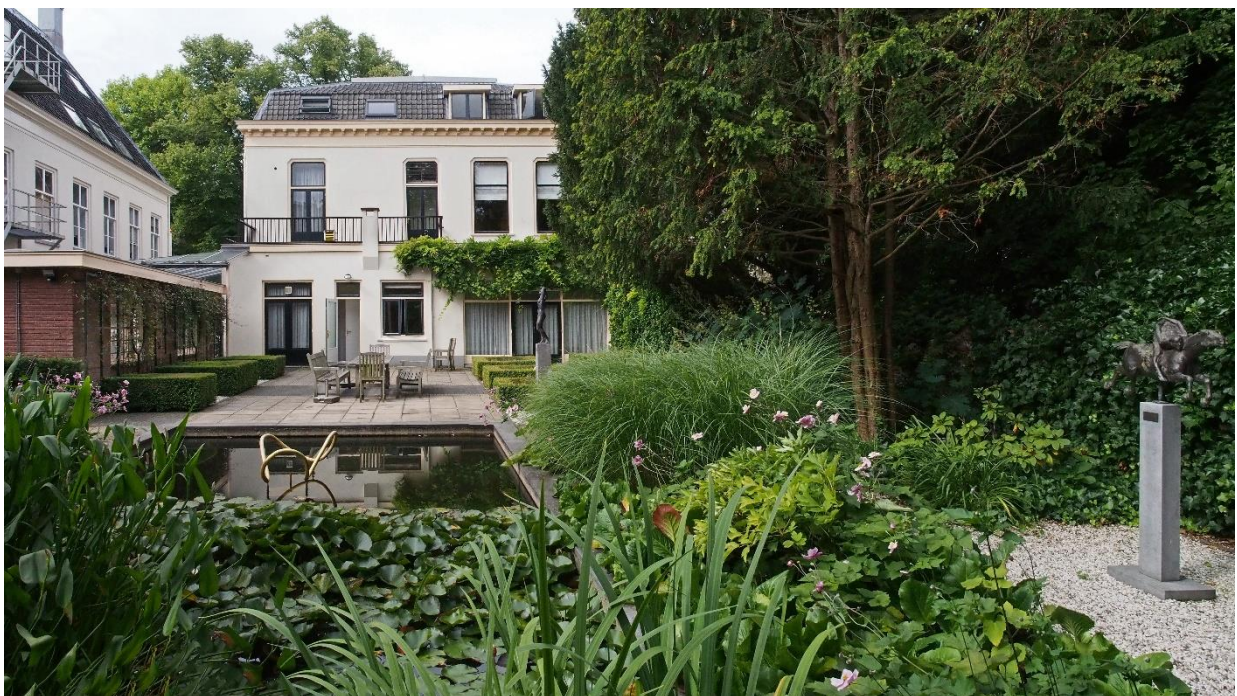
De tuin van de Maliesingel 28

Het pand wordt geregeld nagelopen op mogelijke veiligheidsrisico's (mede op basis van de Risico-Inventarisatie & Evaluatie die is gedaan) en de brandblussers en -melders worden nagekeken. De directeur treedt op als Preventiemedewerker. Een merendeel van de medewerkers is BHV-gecertificeerd. Samen met de huurders worden met regelmaat BHV-oefeningen in het pand georganiseerd.