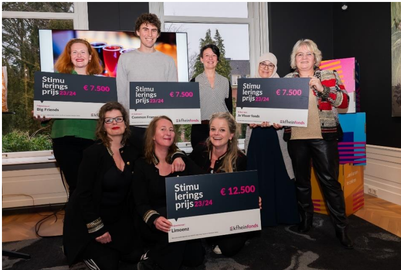
Winnaars stimuleringsprijs

Stimuleringsprijs is beschikbaar om ook vanuit dit perspectief bekeken, klein of groot, projectideeën aan te dragen. We zetten graag iets 'in beweging': in 2023 het jaarthema van het K.F. Hein Fonds om haar 85-jarig jubileum te vieren. Er zijn 9 inzendingen ontvangen, waarvan 4 initiatieven genomineerd zijn voor de prijs. Zij hebben gezamenlijk de workshop gevolgd waarin zij leerden hun maatschappelijke meerwaarde te verwerken in een projectplan. Naar aanleiding van de verbeterde plannen door deze workshop, zijn alle genomineerden in de prijzen gevallen met stichting Limoenz als hoofdprijswinnaar. De feestelijke uitreiking vond plaats op 28 februari 2024. De overige prijswinnaars zijn het Jo Visser fonds, Common Frames en Big Friends Utrecht.