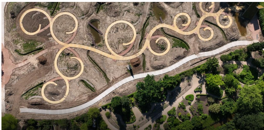
Droneshot Evolutietuin-in-aanleg: foto van bovenaf, toen de paden net werden aangelegd

veel scholen die hun schoolpleinen willen vergroenen. Daarnaast zijn er ook kleinere projecten gerealiseerd in het gebied rondom natuurgebied Amelisweerd.