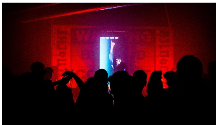
Derde editie Freaky Dancing 2023

Dit jaar vertoonde de groei van aanvragen voor de podiumkunsten (dans, muziek en theater) een minder sterke toename dan in 2022. Er was een toename van 28% in het aantal giften en 22% in het totaalbedrag ten opzichte van 2022. Ondanks de minder sterke toename heeft het fonds in totaal 174 uitvoeringen ondersteund. Naast individuele optredens steunden we ook veel festivals in 2023, namelijk 70 ten opzichte van 48 in 2022. De hoogste bedragen gingen opnieuw naar festivals als Oude Muziek, SPRING festival, Café Theater Festival, Gaudeamus Muziekweek, Nederlands Film Festival en Internationaal Kamermuziekfestival. Soms werd steun specifiek toegezegd voor een bepaald aspect, zoals een randprogramma. Zo ontving Gaudeamus Muziekweek bijvoorbeeld financiering voor het stimuleren van jong talent (Gaudeamus Academy). Ook vierde Het Huis Utrecht haar 10-jarig bestaan in 2023 en vond de derde editie van Freaky Dancing plaats, met aandacht voor de nachtcultuur in Utrecht. Binnen het ondersteunen van podiumkunsten streven we specifiek naar talentontwikkeling, cultuureducatie en een duurzame toekomst in de ruimste zin van het woord.