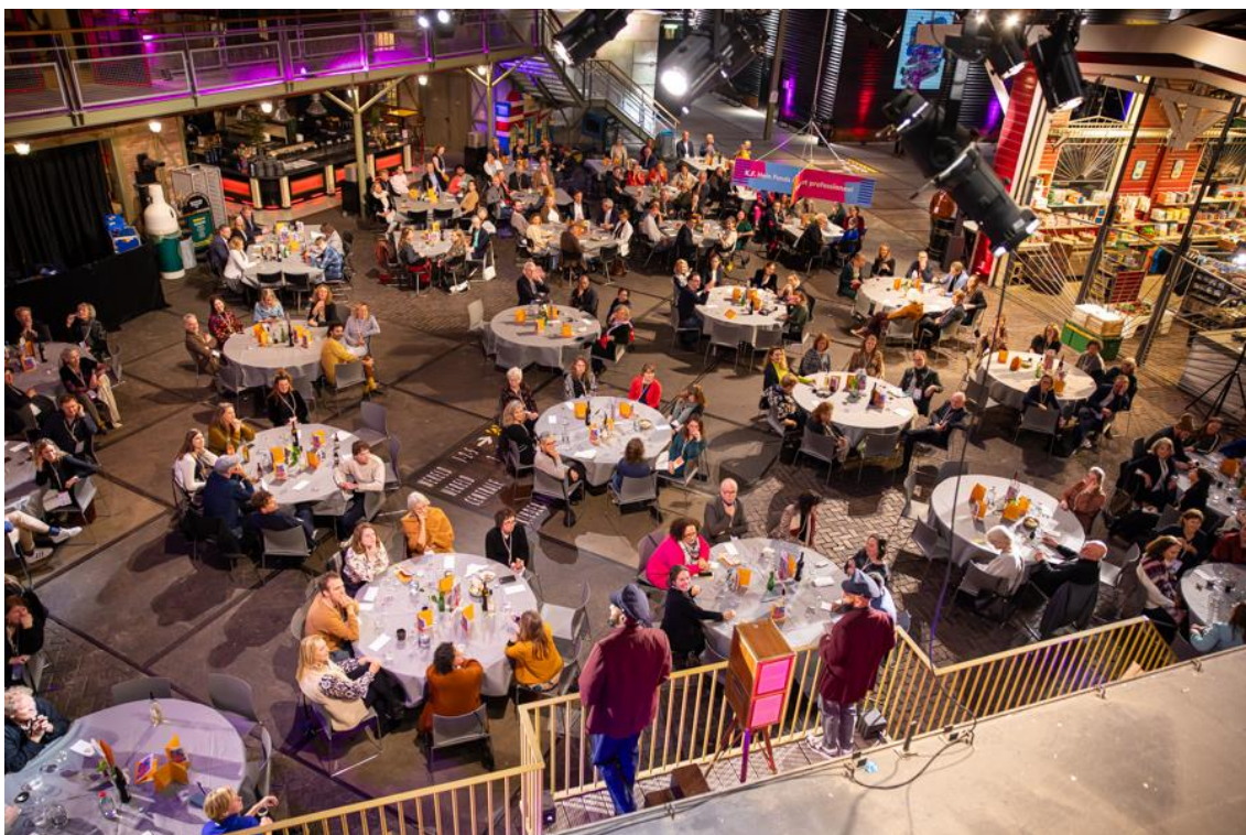
Het 85-jarige jubileumfeest in het spoorwegmuseum op 2 november 2023

Het jaar 2023 stond in het teken van het 85-jarig bestaan van het K.F. Hein Fonds. Een moment om terug te kijken naar alle mooie initiatieven die in de loop der jaren zijn ontstaan. Deze reflectie resulteerde in een prachtige avond in het Spoorwegmuseum, waar het jubileum werd gevierd in aanwezigheid van de familie van K.F. Hein, partners, aanvragers van het fonds, kunstenaars, ontwerpers, dansers, gemeenten en de provincie. Daarnaast werd verder gewerkt aan het boek waarin wordt teruggeblikt op de afgelopen 20 jaar; dit boek zal in 2024 worden gepubliceerd. Het jaar kenmerkte zich ook door het vertrek van directeur Quinten Peelen, die na acht jaar aan het fonds verbonden te zijn geweest, zijn afscheid in september aankondigde, waarna het bestuur op zoek ging naar een opvolger. In december maakte het bestuur bekend dat Anna Kesler in maart 2024 zal starten als nieuwe directeur van het fonds. In 2023 is besloten om de verscheidenheid aan werkterreinen naar buiten toe meer te clusteren tot drie domeinen: Kunst & Cultuur, Mens & Maatschappij en Natuur & Duurzaamheid. Deze domeinen zullen in de komende jaren meer worden uitgediept en geïntegreerd in het algehele beleid van het fonds.